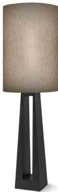
Imagem meramente ilustrativa - Acabamento tecido trabalhado