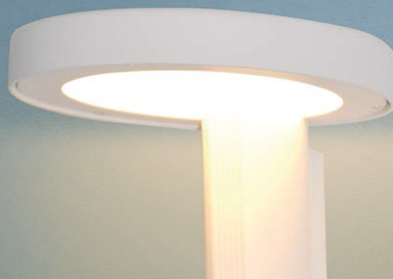
Imagem meramente ilustrativa - Cor Branco Escovado