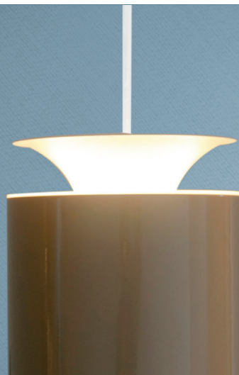
Imagem meramente ilustrativa - Cor Preto texturizado