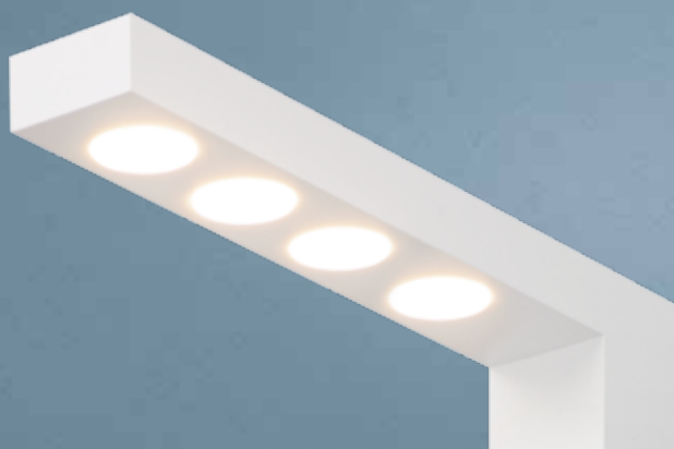
Imagem meramente ilustrativa - Cor Branco texturizado