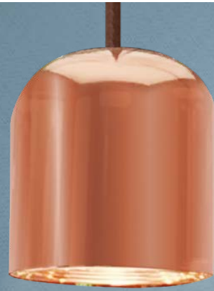
Imagem meramente ilustrativa - Cor Cobre