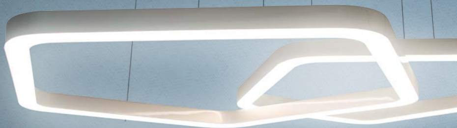
Imagem meramente ilustrativa - Cor Preto texturizado