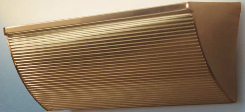
Imagem meramente ilustrativa - Cor Dourado