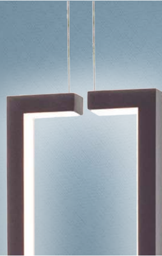
Imagem meramente ilustrativa - Cor Preto texturizado