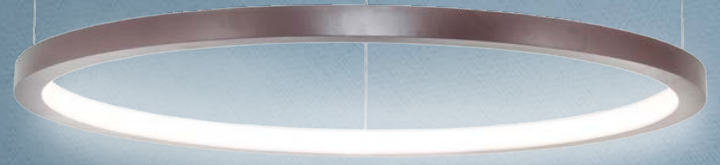
Imagem meramente ilustrativa - Cores Astec Gold e Marrom Topázio