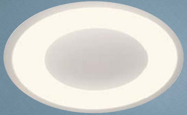
Imagem meramente ilustrativa - Cor Branco texturizado