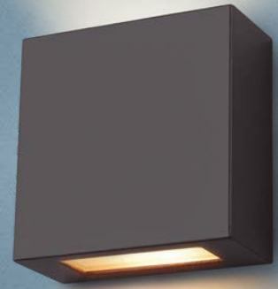
Imagem meramente ilustrativa - Cor Preto texturizado