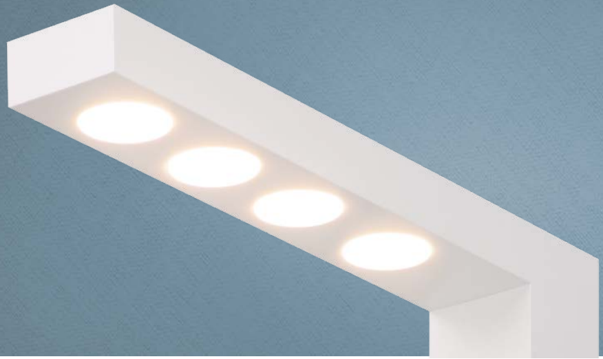
Imagem meramente ilustrativa - Cor Branco texturizado