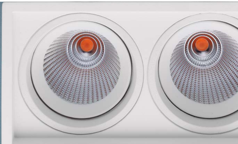
Imagem meramente ilustrativa - Cor Branco texturizado