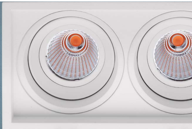
Imagem meramente ilustrativa - Cor Branco texturizado