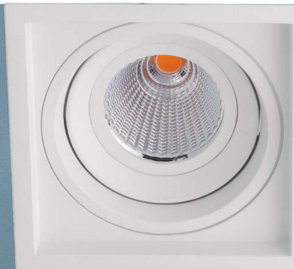
Imagem meramente ilustrativa - Cor Branco texturizado