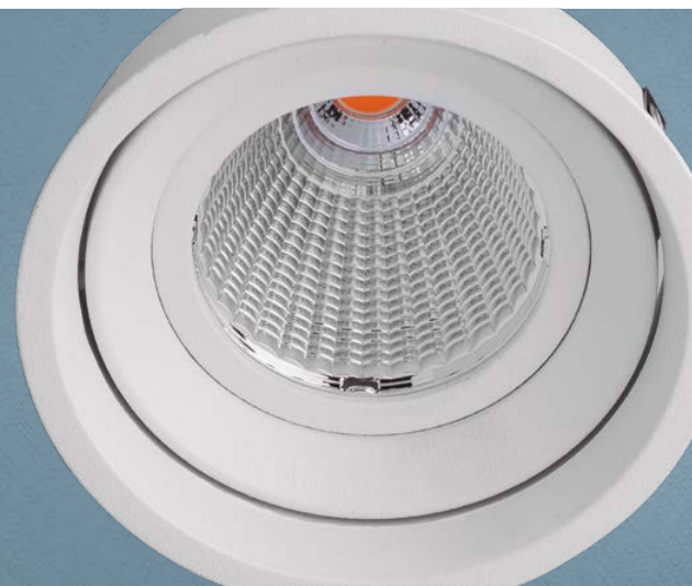
Imagem meramente ilustrativa - Cor Branco texturizado