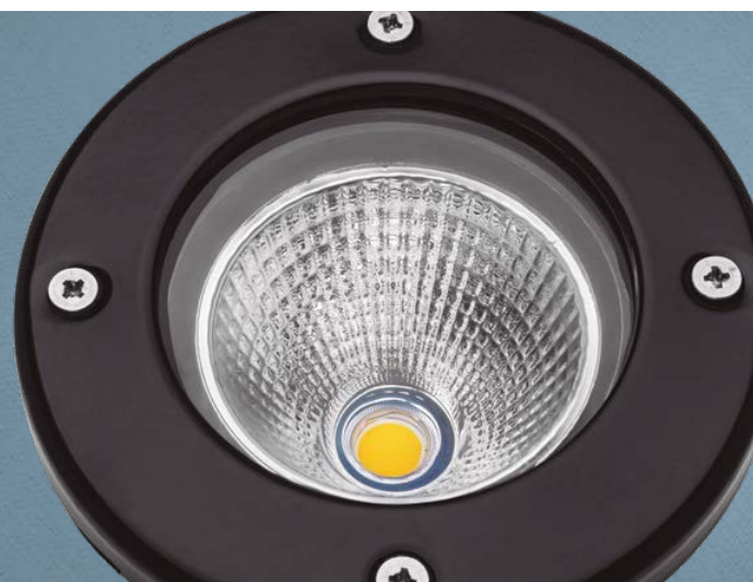
Imagem meramente ilustrativa - Cor Preto brilhante