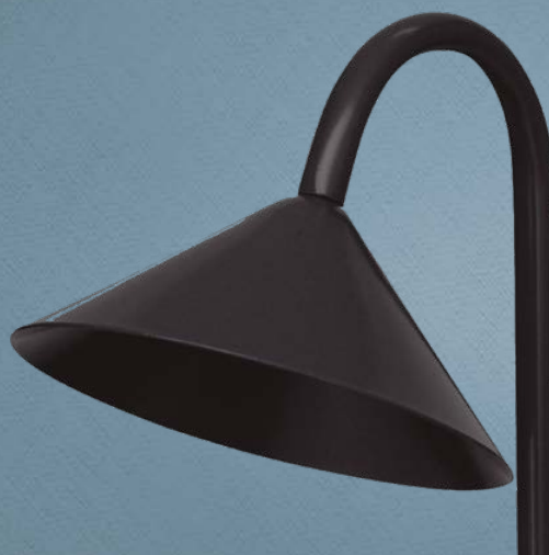
Imagem meramente ilustrativa - Cor Preto brilhante