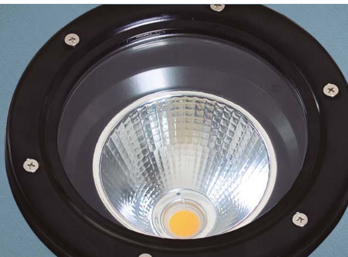
Imagem meramente ilustrativa - Cor Preto brilhante