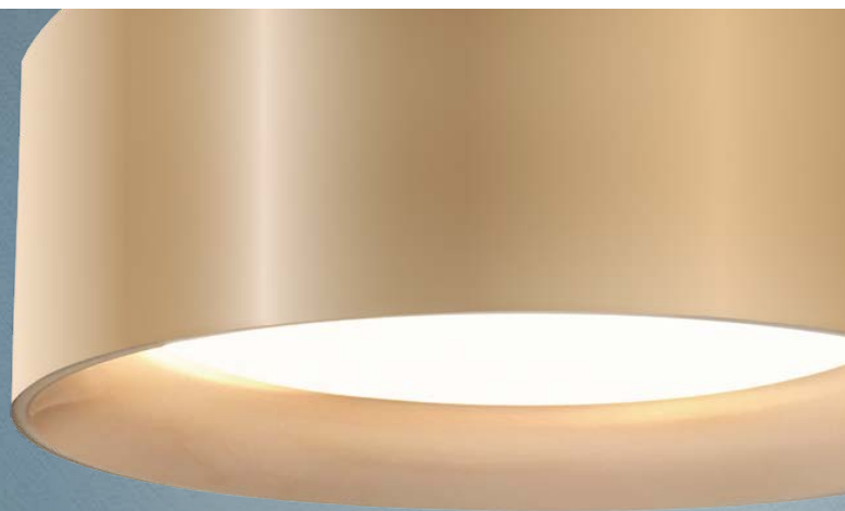
Imagem meramente ilustrativa - Cor Branco texturizado