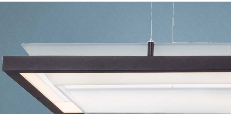
Imagem meramente ilustrativa - Cor Preto texturizado