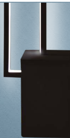
Imagem meramente ilustrativa - Cor Preto texturizado