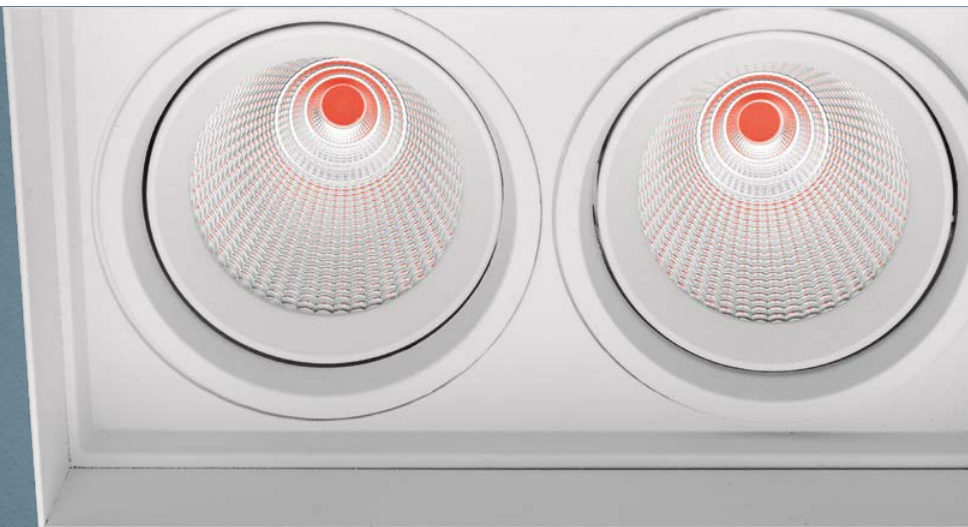
Imagem meramente ilustrativa - Cor Branco texturizado