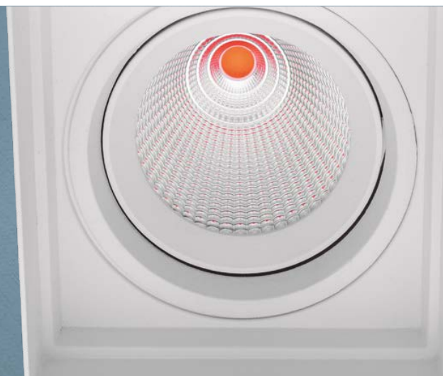
Imagem meramente ilustrativa - Cor Branco texturizado